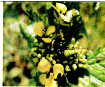
an- und ausgebissene Blütenknospen