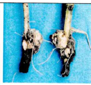
krebsartige Wucherungen an der Wurzel