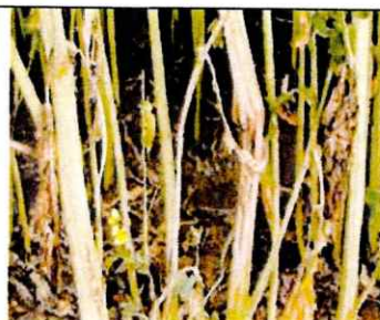
weiße, absterbende Pflanzenstängel, schwarze Dauerkörper im Stängelinneren